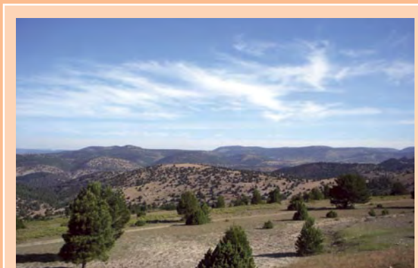
Espectaculares vistas desde la Cruz de los Tres Reinos.