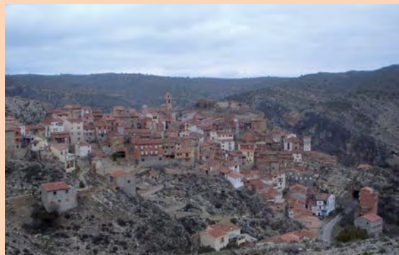
Vista de Castielfabib desde la ruta.