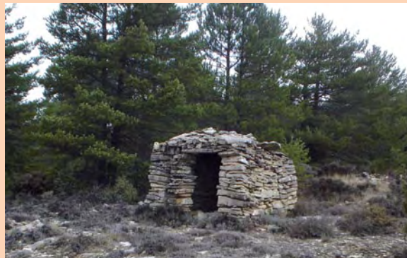
Barraca. Es una construcción rústica de piedra en seco que se puede encontrar por toda la comarca.

Salimos de Castielfabib, por una calle a la izquierda.