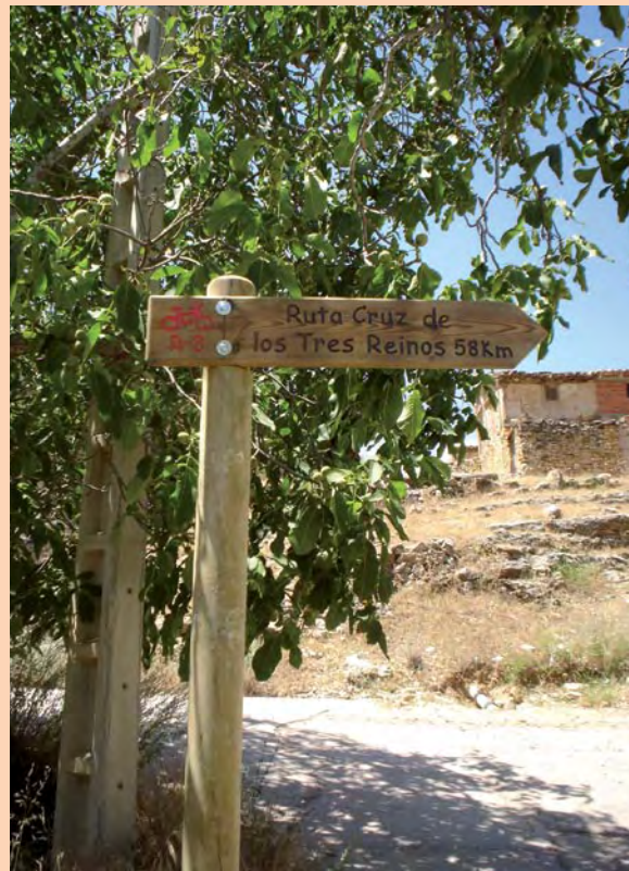
Señal de dirección en la ruta R3

Seguimos recto, dejando un camino a la izquierda.